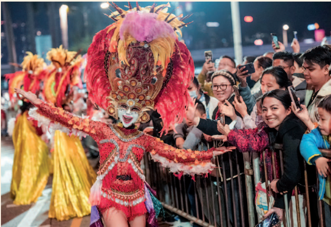
Chinese New Year Night Parade

Hongkong gehört seit Langem zu den besten Orten weltweit, um das chinesische Neujahrsfest zu feiern. Das Jahr der Schlange steht vor der Tür und die Stadt lädt Reisende ein, es mit einer Vielzahl an Feierlichkeiten zu begrüßen. Von den aufregenden Vorbereitungen bis hin zu den lebendigen Festen sprüht die Stadt vor Energie, Farben und unerwarteten Überraschungen, die Hongkong zu einem der attraktivsten Orte machen, um dieses Fest zu erleben. Mit diesen zehn empfohlenen Aktivitäten in Hongkong zum chinesischen Neujahr erleben Besucher unvergessliche Momente, köstliche Genüsse und die Essenz des Festes.