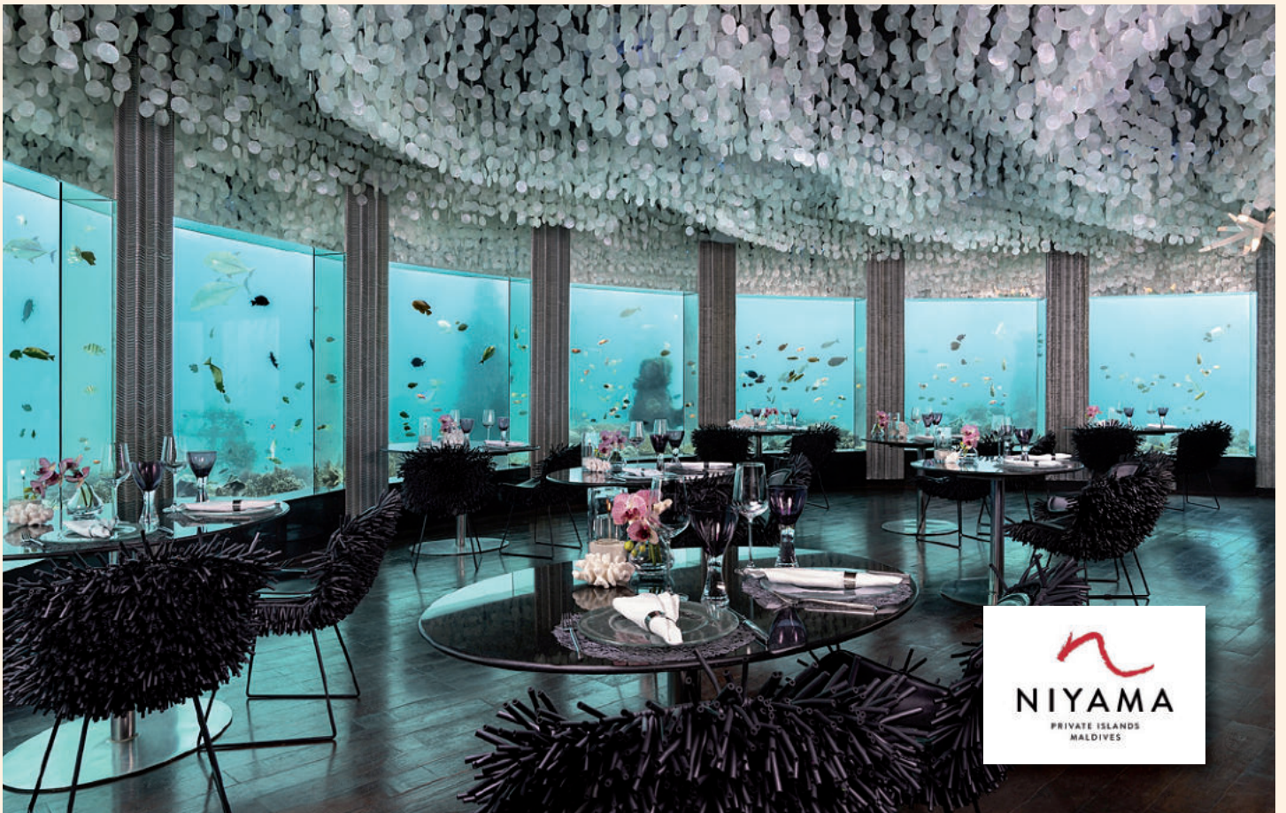
Subsix, das Unterwasserrestaurant des Niyama Private Islands Maldives

R affinierter Mix: Im Subsix, dem Unterwasserrestaurant des Niyama Private Islands Maldives, wartet ab sofort ein neues Erlebnis auf Gourmets. In sechs Metern Tiefe gelegen, ist das Restaurant die erste Location weltweit, in der Gäste unter Wasser in den Genuss einer peruanisch-japanischen Fusionsküche kommen. Das Fünf-Gang-Menü vereint gekonnt die Präzision von Japans Kochkunst mit der bunten Kunstfertigkeit aus Peru. Dabei setzt das