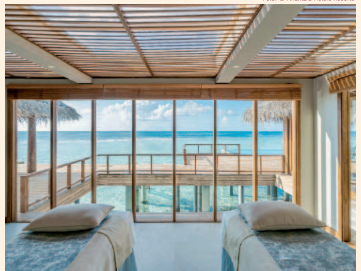
Anantara Kihavah Maldives Villas, Over-Water-Residenz

www.anantara.com/en/kihavah-maldives/spa