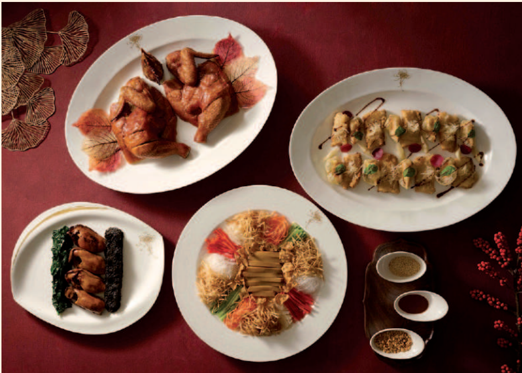
Neujahrs-Delikatessen im Man Ho Chinese Restaurant