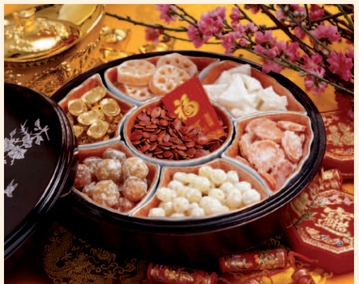
Traditionelle Snack-Schale Chuen Hap

Am 30. Januar begrüßt das eindrucksvolle Feuerwerk über dem Victoria Harbour das neue Jahr. Am 31. Januar erleben Besucher beim Chinese New Year Raceday in der Sha Tin Rennbahn spannende Unterhaltung und eine festliche Atmosphäre.