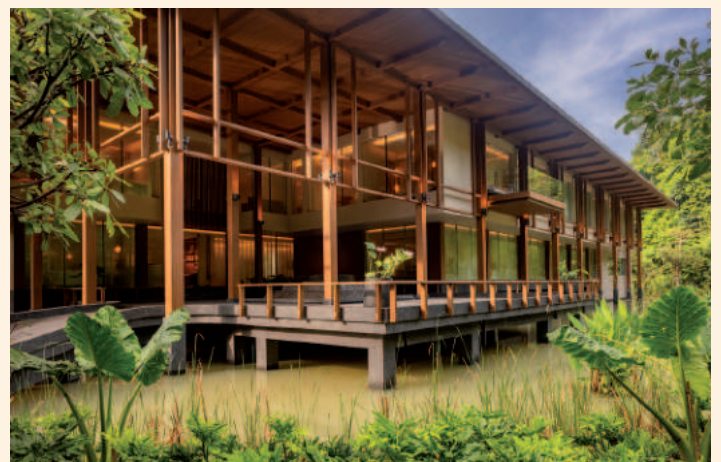
Anantara Layan Wellness Center

Layan Life by Anantara bietet maßgeschneidertes Gewichtsmanagement-Programm: Speziell nach den Feiertagen ist bei vielen der Wunsch nach ein paar Kilos weniger auf der Waage groß. Das neue Gesundheits- und Wellnessretreat Layan Life by Anantara auf Phuket setzt mit seinem „Shape for Life“-Programm auf nachhaltiges Gewichtsmanagement. Basierend auf einem medizinischen Check-Up samt epigenetischen Tests, 3D-Körperscan und einem detaillierten Beratungsgespräch, stellen das Team aus Fachärzten, Physiotherapeuten und Heilpraktikern ein ganzheitliches Retreat mit Fokus auf Ernährung, Fitness und Wellness zusammen. In drei bis zehn Tagen treffen modernste Technologien auf uralte thailändische Heiltraditionen. Das Programm inkludiert je nach Dauer und persönlichen Wünschen unter anderem eine Colon-Hydro-Therapie, Ernährungsberatung, Infusionen, Personal Training-Einheiten, Physiotherapie zur Verbesserung der Körperhaltung, Stretching, Yoga und Pilates, aber auch Anwendungen in der Kältekammer. Für die nötige Entspannung sorgen verschiedene Spa-Treatments wie Gesichtsbildung, Baderitual und Signature Massage. Ein Großteil der Anwendungen findet im neuen, rund 1.800 Quadratmeter großen Gesundheits- und Wellnesszentrum statt. Dieses liegt auf dem Areal des Fünf-Sterne-Resorts Anantara Layan Phuket,